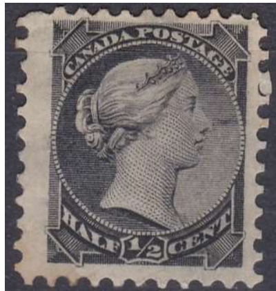
La Reine Victoria

Le PPCLI devient, le 21 décembre 1914, le premier contingent canadien à débarquer en Europe pour combattre l'ennemi. Notons, parmi les nombreux faits d'armes qui l'ont immortalisé, les combats de Frezenberg, le 8 Mai 1915, et la défense de la crête de Vimy, le 9 Avril 1917.