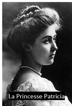
La Princesse Patricia