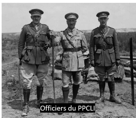
Officiers du PPCLI

Les timbres montrent le Royal 22 ème régiment franchissant une tranchée au cours d'une attaque à l'aube en France, le PPCLI au crépuscule, en route pour effectuer une patrouille de nuit dans une zone de combat en Corée.