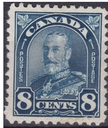
Le Roi George V

Le 20 Mars 1919, le gouvernement canadien intègre le PPCLI à son armée de temps de paix. Il en sera de même après la 2 nd e guerre mondiale, au cours de laquelle le régiment s'est brillamment illustré, particulièrement lors de la campagne d'Italie.