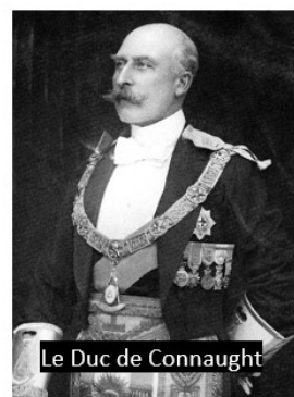
Le Duc de Connaught