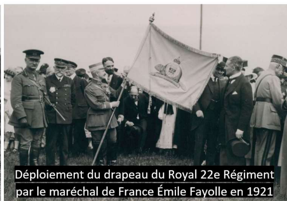
Déploiement du drapeau du Royal 22e Régiment par le maréchal de France Émile Fayolle en 1921